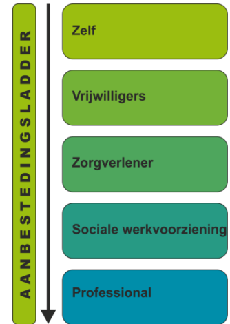
Maatschappelijke aanbestedingsladder IKL

Boventallige medewerkers zijn voor zover mogelijk via een mobiliteitscentrum van werk naar werk geleid. Deze transitie van 62 naar 20 medewerkers vond plaats per 1 mei 2014 en is een ingrijpend proces geweest. Een forse verandering is de overgang naar een organisatie zonder eigen buitendienst. Alle werk dat niet door vrijwilligers uitgevoerd kan worden, wordt nu met behulp van externe partijen uitgevoerd. Daarbij hanteert IKL haar zogenaamde "maatschappelijke aanbestedingsladder". Uitgangspunt is dat IKL landschap bewust wil laten (be)leven door mensen bij hun leefomgeving te betrekken. Hierdoor wordt deze omgeving relevant gemaakt en krijgt zij betekenis. Daarbij laat IKL landschapsdromen uitkomen ( www.landschapsdromen.nl ).